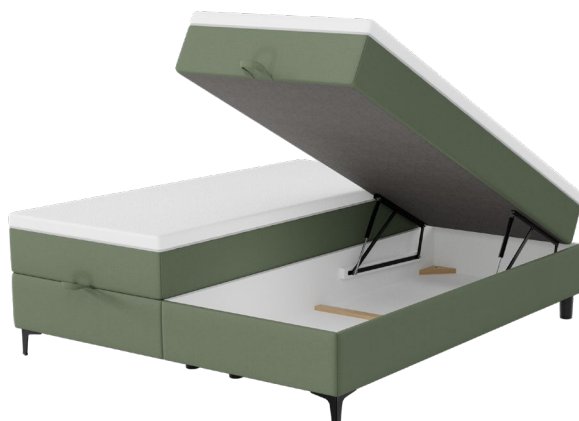
Bettkasten HO 51