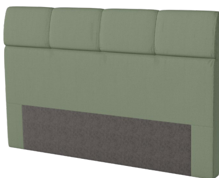
Kopfhaupt HO 01