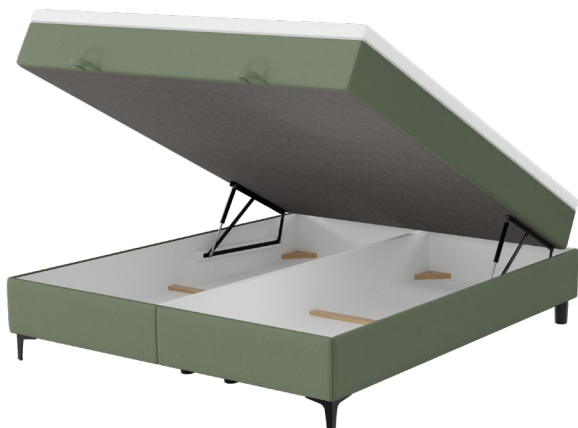
Bettkasten HO 50