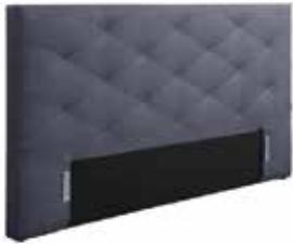
Kopfhaupt TO 01

Beim Bett in der Größe 140x200 cm sind nur die Boxspringbetten geteilt. Die Matratze und der Topper sind im Ganzen.