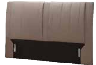
Kopfhaupt TO 03