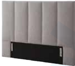
Kopfhaupt TO 02