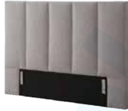
Kopfhaupt TO 02