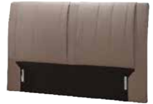
Kopfhaupt TO 03