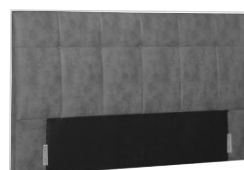
Kopfhaupt VD 03