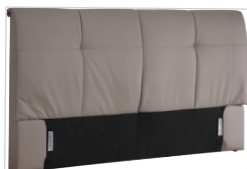
Kopfhaupt VD 02