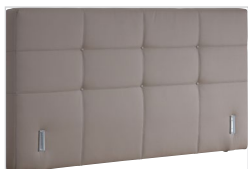
Kopfhaupt VD 01

Folgende Kopfteile sind preisgleich erhältlich: