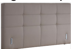
Kopfhaupt VD 01

Folgende Kopfteile sind preisgleich erhältlich: