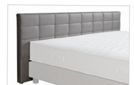
Kopfhaupt VD 04