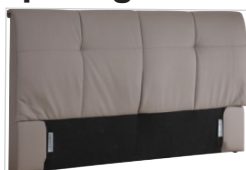
Kopfhaupt VD 02